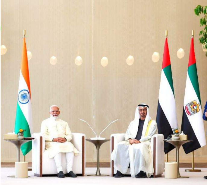
प्रधानमंत्री नरेन्द्र मोदी और यूएई के राष्ट्रपति शेख मोहम्मद बिन जायद अल नाहयान की मौजूदगी में भारत और संयुक्त अरब अमीरात के बीच विभिन्न क्षेत्रों में सहयोग बढ़ाने के लिए समझौता ज्ञापनों का आदान-प्रदान किया गया।

यूएई दौरों के बाद, पीएम मोदी नीदरलैंड के लिए रवाना हो गए। जहां उनकी मुलाकात प्रधानमंत्री रॉब जेटन के अलावा किंग विलेम-अलेक्जेंडर और क्वीन मैक्सिमा से होगी। वार्ता में सेमीकंडक्टर, ग्रीन हाइड्रोजन, इन्वेंशन, रक्षा और जल प्रबंधन जैसे विषय प्रमुख रहेंगे। इसके बाद प्रधानमंत्री स्वीडन का दौरा करेंगे और वहां प्रधानमंत्री उल्फ क्रिस्टर्सन के साथ द्विपक्षीय वार्ता करेंगे।